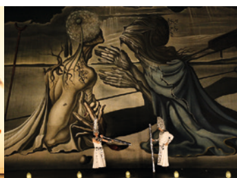
LA VERITÀ